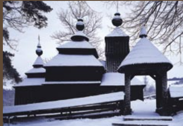
Gréckokatolícky Chrám sv. Mikuláša, Bodružal