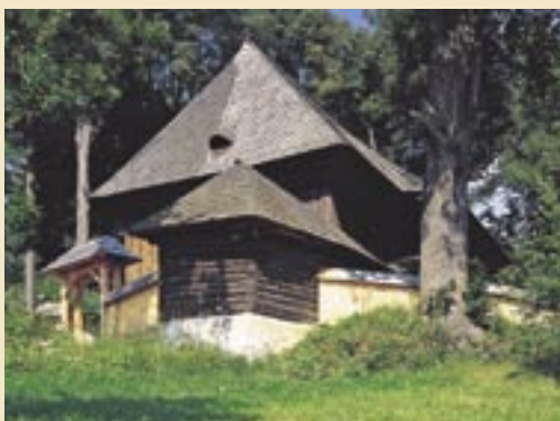
Protestantský artikulárny kostol, Leština

Obyvatelia každého regiónu, no najmä nedostupných a lesom pokrytých území, si vytvárali špecifické postupy spracúvania a používania dreva a zároveň využívali vlastný osobitý umelecký prejav. Preto každý drevený chrám reflektuje konkrétne historické obdobie a individuálne kvality ľudského umu, zručnosti, miestnej tradície a estetického cítenia. Práve výskyt viacerých hodnotných a rôznorodých, no na jednom spoločnom základe existujúcich drevených kresťanských stavieb najlepšie dokumentuje rozmanitosť a zároveň krehkosť tohto vzácneho fenoménu územia strednej Európy.