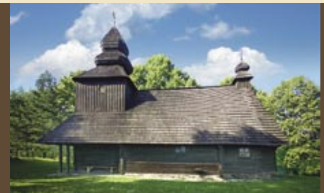
Gréckokatolícky Chrám sv. Mikuláša biskupa, Ruská Bystrá