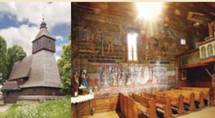
Rímskokatolícky Kostol sv. Františka z Assisi, Hervartov

Gréckokatolícke chrámy, tzv. cerkvi, v Bodružale, Ladomirovej a Ruskej Bystréj boli postavené v priebehu 18. storočia. Sú jedinečnou ukážkou vplyvu, ktorý na drevenej architektúre východu zanechala stavebná kultúra západu. Typická je trojdielnosť ich členenia a charakteristická silueta veží neopakovateľného