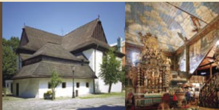
Protestantský artikulárny kostol, Kežmarok